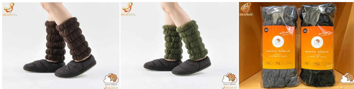
※パッケージイメージ

これからも弊社では、「HEATRAY(ヒートレイ)」のコンセプトの下、企業様、個人様を問わず、美容と健康をサポートする様々な製品・サービスを提供してまいります。ご期待ください！