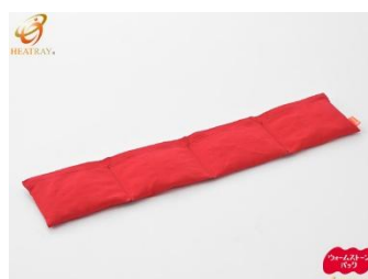
ワイドレンジ【新発売】

持ち運びのできる本格岩盤浴ホットパック HEATRAY『ウォームストーンパック』にご興味のある方は、まずは下記公式 web サイトをご覧ください、ご質問等がございましたら、お問い合わせページよりお気軽にご連絡ください。